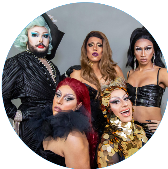
Casa Drag Latina