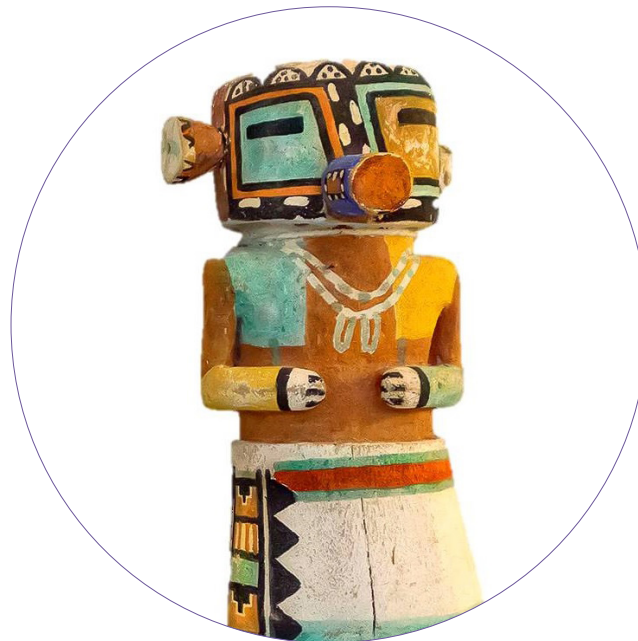
Muñeca "kachina".

Conoceremos su forma de vida en el estado de Arizona, su historia como pueblo, analizaremos su situación actual, y a través de sus coloridas muñecas de madera, sin duda mucho más que un sencillo juguete, descubriremos la importancia que las "kachinas" o "espíritus respetados" tienen para ellos y cómo cada año les rinden culto y festejan en su honor. Para finalizar, nosotros mismos podremos crear nuestra propia muñeca "kachina" y unirnos así a sus rituales y peticiones entorno a la lluvia, el sol o los cultivos. ¡Apúntate y no te lo pierdas!