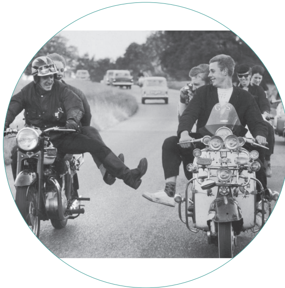
Imagen de la exposición.

¿Qué conoces sobre las culturas mod y rocker? ¿Quieres saber más? ¡No faltes a esta cita!