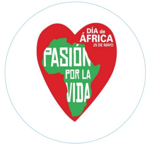
Imagen del Día de África

*Reserva previa a través del formulario https://cutt.ly/DiaDeAfrica2024