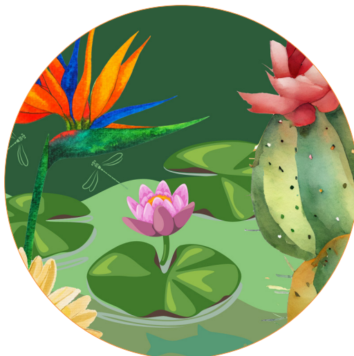
Detalle del cartel del campamento.

B. LAS HUELLAS DE LA BIODIVERSIDAD: semanas del 1 al 5 de julio y del 15 al 19 de julio.