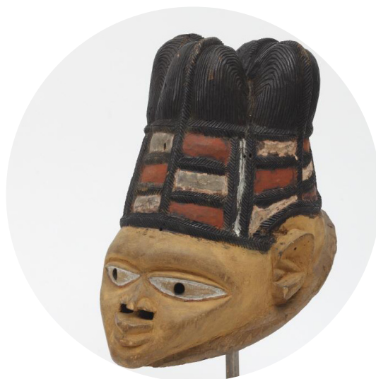
Máscara gelede.

El equipo de mediación cultural del MNA presenta un viaje por la exposición permanente a través de piezas representativas de diferentes partes del mundo. De este modo podréis aproximaros a la inmensa diversidad cultural que existe en nuestro planeta. ¿Os apuntáis?