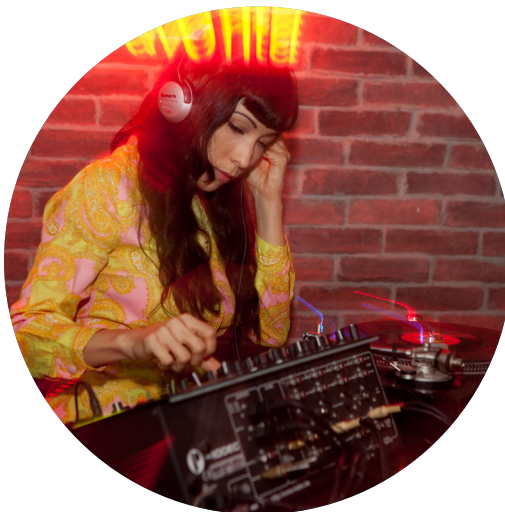
Festival yeyé. Gijón 2012.