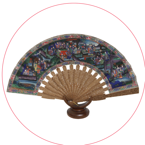
Abanico "de las mil caras". China. Siglo XIX.

Salas de exposiciones temporales. Sábado 4 de mayo a las 11:30h.