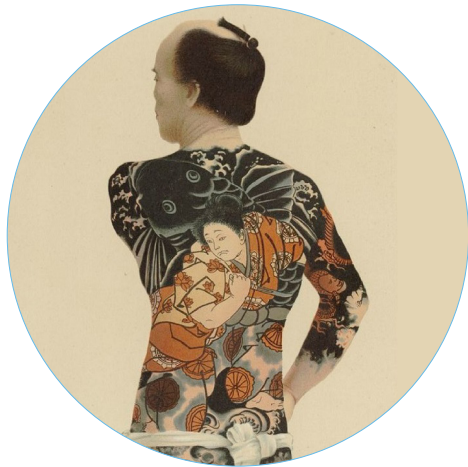
Litografía sobre fotografía coloreada de tatuajes japoneses, extraída del tratado publicado por el antropólogo alemán Wilhem Joest.