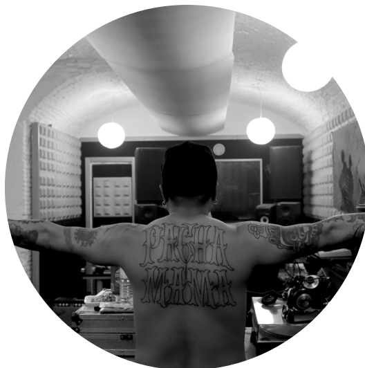
5JC de Pachamama Familia.

Migración y Cultura es una versión ampliada de la muestra realizada en julio de 2021 en La Parcería CCEDA con el título "El Otrx. Arte, cultura y migración en la ciudad de Madrid", realizada en colaboración con el MNA. La muestra estará acompañada por una programación cultural especialmente diseñada para la ocasión.