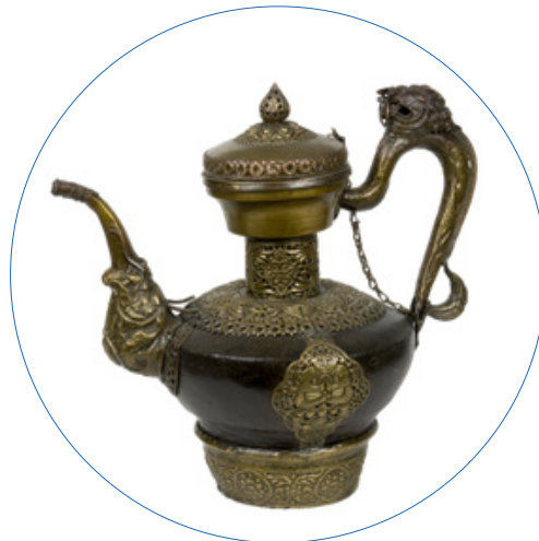
Tetera. Tíbet. Siglos XVIII-XIX. MNA CE8453.

¿Te tomas una taza de té con nosotrxs? ¡Anímate a conocer las culturas del té!