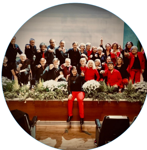
Coro Voces Bravas.

¡No puedes faltar! Apúntate a esta cita musical en el MNA.